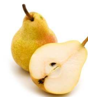
Vol T.O. 2009