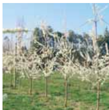
La floraison des variétés américano-japonaises est le plus souvent importante et homogène.