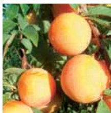
Quelle que soit la variété considérée, la pollinisation croisée des pruniers américano-japonais est un élément déterminant à la réussite du verger.