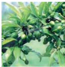
Le taux de nouaison obtenu à chaque essai renseigne sur la compatibilité pollinique des variétés testées.

Pour cette étude, le protocole expérimental consiste à prélever du pollen de la variété prescrite comme « pollinisatrice » pour le déposer à l'aide d'un pinceau sur le stigmate des